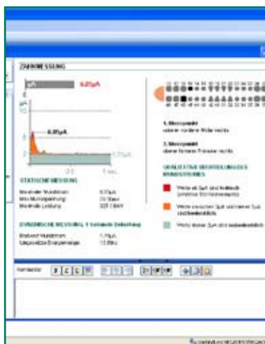
Das Bild zeigt die Ergebnisse nach der Zahnmessung